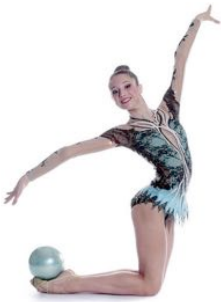
Justaucorps modèle « Aïda » Ballon HV PASTORELLI En vente sur notre site

Tous les modèles sont déposés donc interdits à la reproduction, même partielle. Merci de votre compréhension