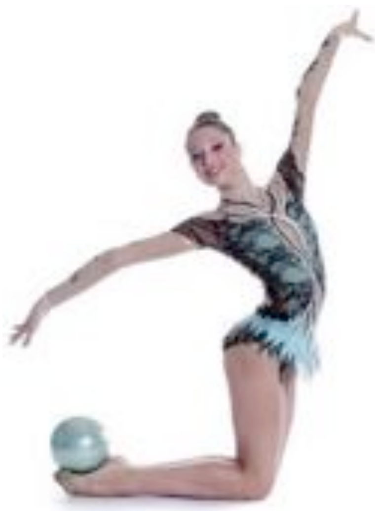
Justaucorps modèle « Aïda » Ballon HV PASTORELLI En vente sur notre site

Tous les modèles sont déposés donc interdits à la reproduction, même partielle. Merci de votre compréhension